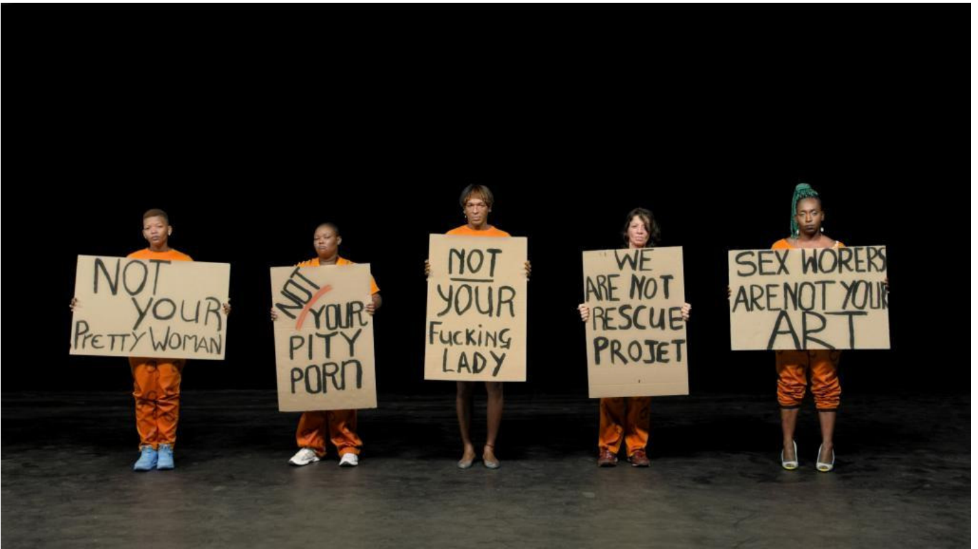
Candice Breitz, scene from "TLDR", 2017